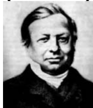
Joseph Liouville (1809-1882)

תהי f אנליטית בתחום חסום D , ורציפה ב- \bar{D} . אז |f(z)| מקבלת את המקסימום שלה על השפה של D ( \partial D ).